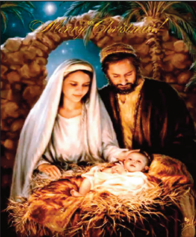
ਅਦਾਰਾ ਦੇਸ਼ ਦੁਆਬਾ ਵੱਲੋਂ ਕੁੱਲ ਲੋਕਾਈ ਨੂੰ ਕ੍ਰਿਸਮਿਸ ਦੀਆਂ ਲੱਖ-ਲੱਖ ਵਧਾਈਆਂ।

ਮੁੱਖ ਸੰਪਾਦਕ : ਪ੍ਰੇਮ ਕੁਮਾਰ ਚੰਬਰ ਸੰਪਾਦਕ : 916-947-8920 ਫੈਕਸ : 916-238-1393 E-mail : deshdoaba@yahoo.com ਸੰਪਾਦਕ : ਤਰਸੇਮ ਜਲੰਧਰੀ