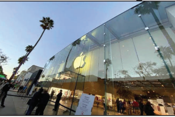
ਸਟੋਰ ਬੰਦ ਰੱਖੇ ਜਾਣਗੇ। ਐਪਲ ਦੇ ਇੱਕ ਬੁਲਾਰੇ ਨੇ ਦੱਸਿਆ ਕਿ ਕਈ ਕਮਿਊਨਿਟੀਆਂ ਵਿੱਚ ਮੌਜੂਦਾ ਕੋਰੋਨਾ

ਗੁਰਿੰਦਰਜੀਤ ਨੀਟਾ ਮਾਛੀਕੇ / ਕੁਲਵੰਤ ਧਾਲੀਆਂ, ਫਰਿਜ਼ਨੋ (ਕੈਲੀਫੋਰਨੀਆ)– ਦੁਨੀਆਂ ਭਰ ਵਿੱਚ ਆਪਣੇ ਮੋਬਾਈਲ ਫੋਨਾਂ ਦਾ ਦਬਦਬਾ ਕਾਇਮ ਰੱਖਣ ਵਾਲੀ ਕੰਪਨੀ 'ਐਪਲ' ਕੋਰੋਨਾ ਵਾਇਰਸ ਦੀ ਵਧ ਰਹੀ ਲਾਗ ਪ੍ਰਤੀ ਕਾਫੀ ਸਾਵਧਾਨ ਹੈ। ਅਮਰੀਕੀ ਸੂਬੇ ਕੈਲੀਫੋਰਨੀਆ ਵਿੱਚ ਕੋਵਿਡ -19 ਕੇਸਾਂ ਦੇ ਹੋ ਰਹੇ ਵਾਧੇ ਦੇ ਦੌਰਾਨ ਐਪਲ ਰਾਜ ਵਿਚਲੇ ਆਪਣੇ ਸਾਰੇ ਸਟੋਰ ਅਸਥਾਈ ਤੌਰ 'ਤੇ ਬੰਦ ਕਰ ਰਿਹਾ ਹੈ। ਐਪਲ ਦੁਆਰਾ ਦਿੱਤੇ ਬਿਆਨ ਅਨੁਸਾਰ ਕੈਲੀਫੋਰਨੀਆ ਵਿੱਚ ਵਾਇਰਸ ਦੀ ਵਜ੍ਹਾ ਨਾਲ ਹਸਪਤਾਲ ਵਿੱਚ ਦਾਖਲ ਹੋਣ ਵਾਲੇ ਮਰੀਜ਼ਾਂ ਦੀ ਗਿਣਤੀ ਵਿੱਚ ਚਿੰਤਾਜਨਕ ਵਾਧਾ ਹੋਣ ਕਰਕੇ ਅਗਲੇ ਨੋਟਿਸ ਤੱਕ ਕੰਪਨੀ ਦੇ ਸਾਰੇ 53