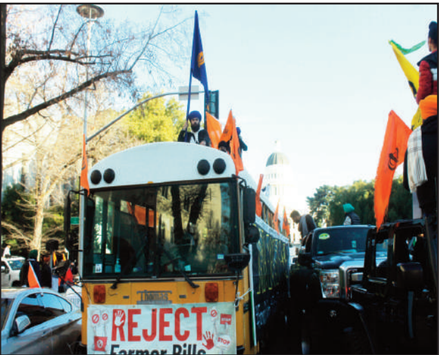
ਭਾਰਤ ਸਰਕਾਰ ਦੇ ਤਿੰਨ ਕਿਸਾਨ ਬਿਲਾਂ ਦੇ ਵਿਰੋਧ ਵਿਚ ਸੈਕਰਾਮੈਂਟੋ ਵਿਖੇ ਵਿਰੋਧ ਪ੍ਰਦਰਸ਼ਨਾਂ ਦੀਆਂ ਦੇਸ਼ ਦੁਆਬਾ ਵੱਲੋਂ ਲਈਆਂ ਕੁਝ ਝਲਕੀਆਂ ਅੰਦਰ ਦੇਖੋ।

ਮੁੱਖ ਮਹਿਮਾਨ ਬਰਤਾਨੀਆ ਦੇ ਪ੍ਰਧਾਨ ਮੰਤਰੀ ਬੋਰਿਸ ਜੌਨਸਨ ਨੂੰ ਭਾਰਤ ਆਉਣ ਤੋਂ ਰੋਕਣ ਲਈ ਬਰਤਾਨਵੀ ਸੰਸਦ ਮੈਂਬਰਾਂ 'ਤੇ ਦਬਾਅ ਪਾਇਆ ਜਾਵੇਗਾ। ਉਧਰ ਸਿੰਘੂ ਬਾਰਡਰ ਸਮੇਤ ਵੱਖ ਵੱਖ ਮੋਰਚਿਆਂ 'ਤੇ ਅੱਜ ਦੂਜੇ ਦਿਨ ਵੀ ਕਿਸਾਨ ਭੁੱਖ ਹੜਤਾਲ 'ਤੇ ਬੈਠੇ। (ਬਾਕੀ ਸਫਾ 39 'ਤੇ)